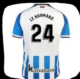
Robin Le Normand