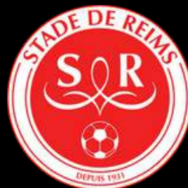
Stade de Reims