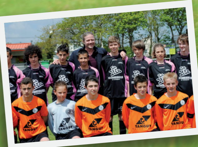
Emmanuel Petit, Champion du Monde 1998, parrain de l'édition 2013.